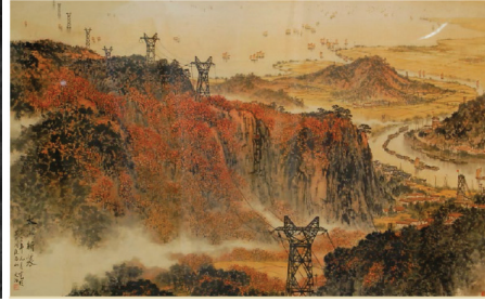
-Toplumsal Gerçekçilik ve Sanayileşme, 1975, 1979-

Kaynak: Smith, 2018: 220, 221; Kiaer, 2014: 61.