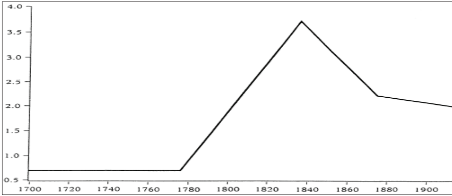
Şekil 1: Sanayileşme ve Endüstriyel Üretimdeki Artış Eğilimi

Sanayileşmeyle birlikte ise kavram, 'yapay' bir nitelik kazanmıştır. Nitekim sanayileşmeden sonra ev ile iş hayatı kesin çizgilerle birbirlerinden ayrılmış ve 'çalışma' ile 'boş zaman' kavramları tartışmaların temelini oluşturmuştur. Tarihi bir kırılma noktası olarak ele alınan bu dönem sonunda emek, 'çalışma' ile 'boş zaman' kullanma arasında tercih yapan ve yaptığı tercihlerin alternatif maliyetlerine katlanmak zorunda kalan, ayrıca kapitalizmin dişlileri arasında öğütülen bir metaya dönüştürülmüştür. Hür teşebbüsün ve piyasa ekonomisinin gelişmesine paralel olarak üretim ve kârlılık artmış ancak emek, ağır çalışma koşullarını ve uzun çalışma sürelerini bir zorunluluk olarak dayatan işveren karşısında marjinalleşmekten ve dezavantajlı hale gelmekten kurtulamamıştır (Yüksel, 2014: 258; Sanayi Devrimi ve sanayileşmeyle ilgili olarak ayrıca bkz. De Vries, 1994: 249-270; Berg ve Pat, 1992: 24-50; Hoppit, 1990: 173-193; Ó Gráda, 2016: 224-239; Crafts, 2011: 153-168; Beaudoin, 2000: 7-13; Clark ve Jacks, 2007: 39-72; Voth, 2003: 221-226; Crafts, 2005: 525-534).