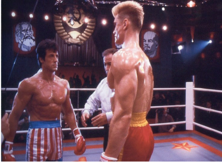
Resim 3: Dünya Sinemasında Toplumsal Gerçekçilik ve 'Soğuk Savaş'

hamisi konumundaki Amerika ideolojik olarak kapitalizmi ve hür teşebbüsü savunan bir politika izlerken ve dünyanın da kurtuluşunun bu anlayıştan geçtiğini ifade ederken, Doğu'nun yegâne temsilcisi Rusya ise tek çıkar yolun sosyalizm olduğunu iddia etmektedir. Her iki blok da ideolojik görüşlerini sadece kendisi kabul etmemekte aynı zamanda diğer ülkelere de dayatmak ya da ihraç etmek suretiyle onları bir seçim yapmaya zorlamaktadır. İşte tam da bu dönemde politik ve ideolojik anlayışla kendisini daha da tahkim eden toplumsal gerçekçi sinema, savunduğu ideolojik değerlerin propaganda aygıtına dönüşmüştür. Nitekim böylesi bir manzara, Del Sarto (2005) tarafından savunulan politik sinemanın temelinde popülizmin, milliyetçiliğin ve ideolojinin var olduğu şeklindeki savı doğrulamaktadır (Del Sarto, 2005: 80). Ayrıca Harris'in (2015) sinemanın propaganda makinesi olduğu şeklindeki iddiaları da ete kemiğe bürünmektedir (Harris, 2015: 221). Dolayısıyla, sinemadaki toplumsal gerçekçilik anlayışını politik sinema düşüncesinden soyutlamak olası değildir, çünkü toplumsal gerçekçiliğin özünde ideoloji ve rejim propagandası vardır. Sinema da diğer sanat türlerinde olduğu gibi, bu amaca hizmet etmektedir.